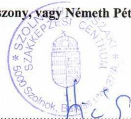
Hicsó György főigazgató